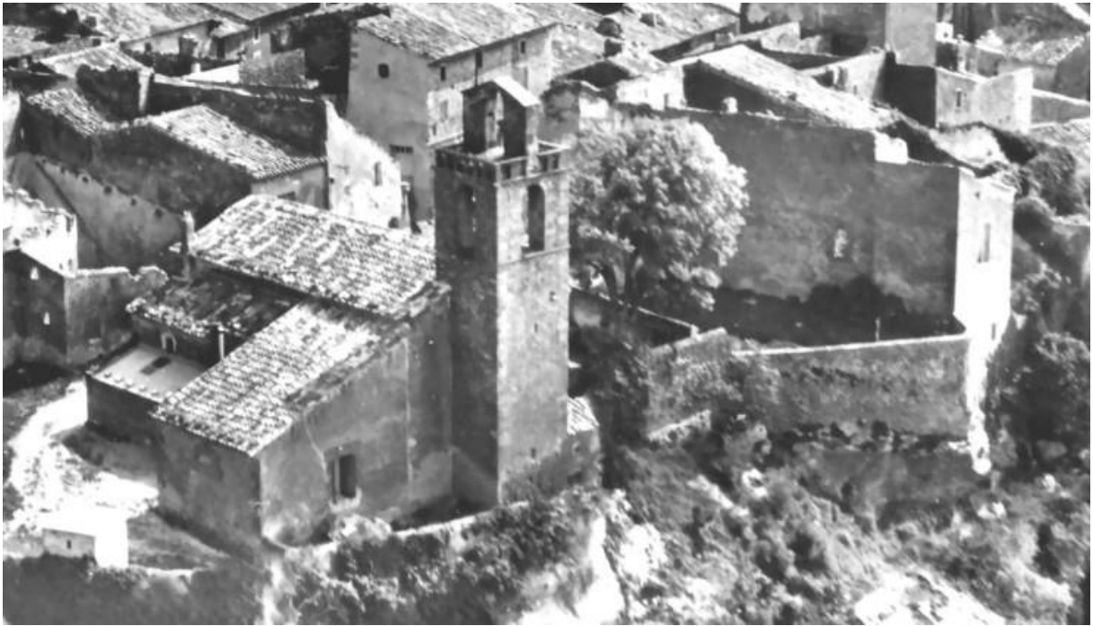
Emplacement du cimetière