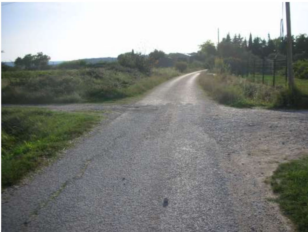
Emplacement de la croix à gauche sur la butte