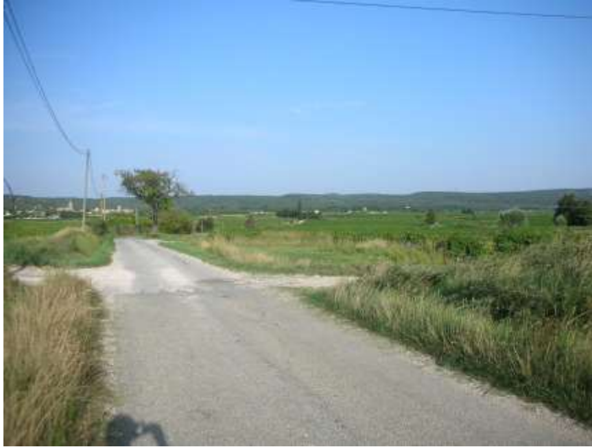
Chemin de Castillon ( vers St Hilaire ) et chemin des tuileries vers Castillon « chemin de la draille de droite à gauche ( limite des communes )